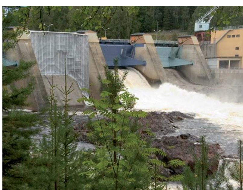
Torrläggning av åfåror gör fiskvandringen omöjlig. Forsmo kraftverk är Ångermanälvens näst nedersta kraftverk från mynningen. Det skulle vara möjligt att få upp lax och havsöring både till och förbi Forsmo kraftverk.