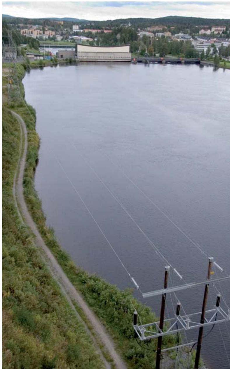
Vid Sollefteå kraftverk är det stopp för fiskvandringen. Eds fvof anser att det bör byggas fiskvägar förbi kraftverken i Ångermanälven.

Sollefteå och ett minivattenflöde förbi kraftverken uppströms Ed så skulle man till och med kunna återskapa naturlekande lax och havsöring i älven och dessutom förbättra allt slags fiske på älvräckorna mellan kraftverken. I Sollefteå kommun, med bland annat Ångermanälven, Faxälven och Fjällsjöälven, finns 25 fiskevårdsområden som på olika sätt kan gynnas av fiskvägar, miniflöden och andra modifieringar av vattenkraftens effekter.